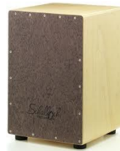
Djembe und Cajon (Es werden beide Instrumente erlernt!)